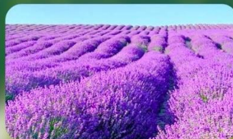
ทุ่งลาเวนเดอร์