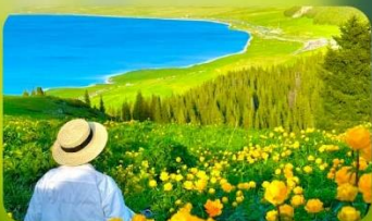
ทะเลสาบไซท์ลี่มู่