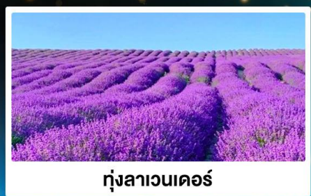
ทุ่งลาเวนเดอร์