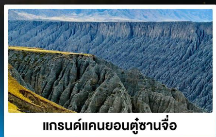
แกรนด์แคนยอนคู่ซานจื่อ