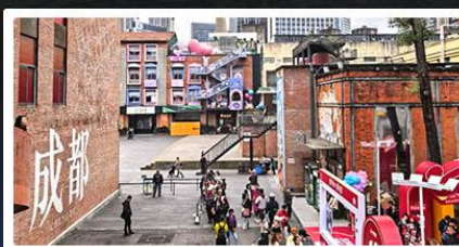
ตงเจียวจื้ออี้