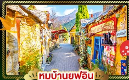
หมู่บ้านยฟูอิน