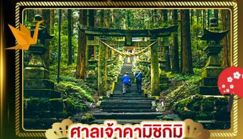
ศาลเจ้าคามิชิมิ