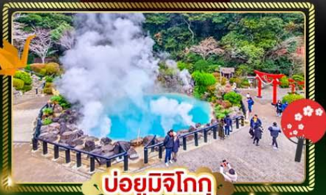
บ่อน้ำพุร้อน