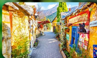
หมู่บ้านยูฟุอิน