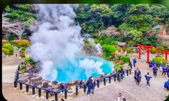
บ่อยูมิจิโกกุ

FUKUOKA AREA หรือเทียบเท่ามาตรฐานญี่ปุ่น