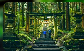
ศาลเจ้าคามิชิกิมิ