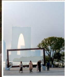
SUZHOU LARGE PHOTO FRAME