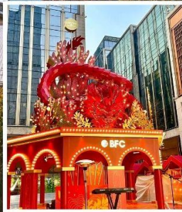
THE BUND WEEKEND MARKET BFC