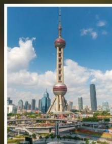
ชั้นหอไข่มุก