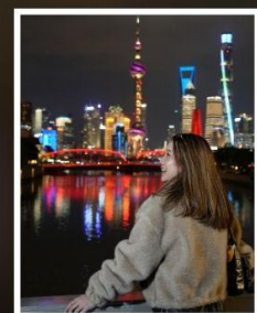
เซี่ยงไฮ้ คลาสสิก ไทท์