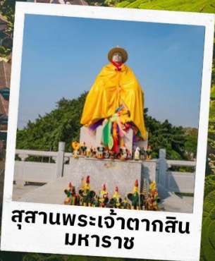
สุสานพระเจ้าตากสิน มหาราช