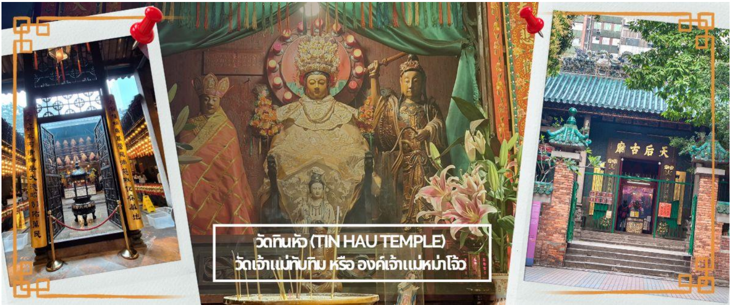
วัดทินเฮว (TIN HAU TEMPLE) วัดเจ้าแม่ทับทิม หรือ องค์เจ้าแม่เก้าโจ้ว

การเงิน และความสำเร็จในชีวิตได้ตามที่ต้องการ และที่ไม่ควรพลาดกับการปิดทองที่เรือมังกร โดยมีความเชื่อว่าจะทำให้พรที่ขอไว้กับองค์เจ้าแม่ทับทิมสัมฤทธิ์ผลโดยเร็ว