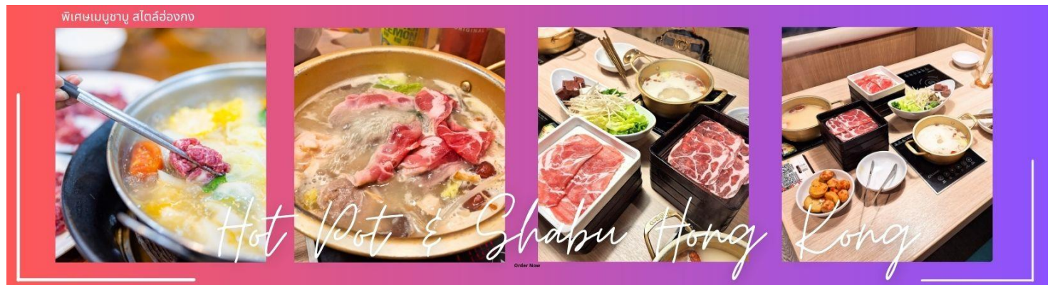
พิเศษเมนูชาบู สไตส์ฮ่องกง

กลางวัน 101 บริการอาหารกลางวัน ณ ภัตตาคาร พิเศษ เมนูชาบู สไตส์ฮ่องกง (5)