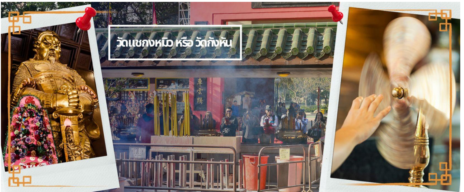
วัดแชกงหรือ วัดกั๊งหัน

จากนั้นนำท่านเดินทางสู่ วัดแชกง ที่ซาถิ้น (CHE KUNG TEMPLE AT SHA TIN) วัดแชกงสร้างขึ้นเพื่อเป็นอนุสรณ์เพื่อรำลึกถึงตำนานแห่งนักรบราชวงศ์ซ่ง มีนามว่า “แช กง” แม่ทัพปราบศึก ผู้คนทั่วทุกดินแดนต่างยำเกรงในกำลังพลอันกล้าหาญแข็งแกร่งของแม่ทัพแชกง ตั้งอยู่ในเขต SHATIN มีประวัติเล่าต่อกันมาว่า ขณะที่ เป็นแม่ทัพปราบศึกอยู่นั้น ทุกแคว้นเขตแดนแผ่นดินใหญ่ต่างก็ยำเกรงต่อกำลังพลที่กล้าหาญในกองทัพของท่าน ยามที่ออกรบเพื่อต้านข้าศึกศัตรูทุกทิศทาง ทุก ๆ ครั้ง ท่านใช้สัญลักษณ์รูปกังหัน 4 ใบพัดติดไว้ด้านหลังรถศึกนำขบวนในกองทัพ เหล่าทหารกล้ามีความเชื่อว่าเมื่อพกพาสัญลักษณ์รูปกังหันนี้ไป ณ ที่ใดๆ กังหันนี้ก็จะช่วยเสริมสิริมงคล นำพาแต่ความโชคดี มีอำนาจเข้มแข็ง เสริมกำลังใจให้แก่กองทัพของท่าน ชื่อเสียงในการนำทัพสู้ศึกของท่านจึงเป็นตำนานมาจนทุกวันนี้ ปัจจุบันวัดแชกง จึงเป็นสถานที่สักการะเคารพ ขอพร ท่านแชกง โดยมีสัญลักษณ์เป็นกังหันนำโชค การหมุนกังหันนำโชคที่ตั้งอยู่ในวัด เพื่อจะได้หมุนเวียนชีวิตของเราและครอบครัวให้มีความเจริญก้าวหน้าด้านหน้าที่การงาน โชคลาภ ยศศักดิ์ และถ้าหากคนที่ดวงไม่ดีมีเคราะห์ร้ายก็ถือว่าเป็นการช่วยหมุนปัดเป่าเอาสิ่งร้ายและไม่ดีออกไปให้หมด ในองค์กังหันนำโชคมี 4 ใบพัด คือพร 4 ประการ ได้แก่ สุขภาพร่างกายแข็งแรง, เดินทางปลอดภัย, สมความปรารถนา และเงินทองไหลมาเทมา ในทุกๆวันที่ 2 ของเดือนแรกตามปฏิทินจีนชาวฮ่องกงและนักธุรกิจจะมาวัดนี้เพื่อถวายกังหันลมเพราะเชื่อว่ากังหันจะช่วยพัดพาสิ่งชั่วร้ายและโรคร้ายใช้เจ็บออกไปจากตัวและนำพาแต่ความโชคดีเข้ามา