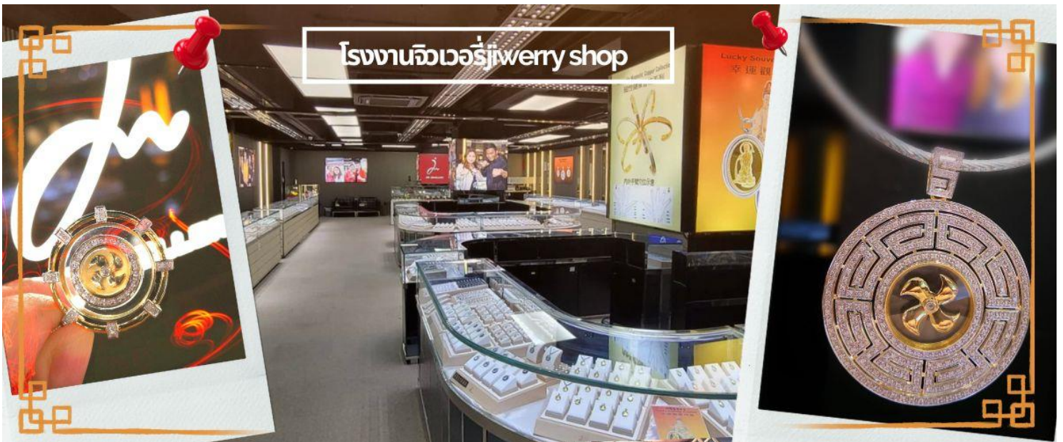
โรงงานจิวเวอรี่ jewelry shop

จากนั้นนำท่านชม โรงงานจิวเวอรี่ ซึ่งเป็นโรงงานที่มีชื่อเสียงที่สุดของฮ่องกงในเรื่องการออกแบบเครื่องประดับ อาทิ เช่น จี้ และแหวนกำหันทน์ ที่สวยงามโดดเด่นไม่เหมือนใคร ซึ่งถือกำเนิดขึ้นที่นี่และมีชื่อเสียงที่สุดใช้เป็นเครื่องประดับติดตัว และเสริมดวงชะตา สินค้าทุกชิ้นมีเอกสารรับประกันคุณภาพเปลี่ยน ซ่อม ด้ตลอดอายุการใช้งาน หากเกิดการชำรุดจากสินค้าไม่ใช่อุบัติเหตุ และนำท่านเลือกซื้อ เครื่องประดับที่ ร้านหยก ซึ่งคนจีนนั้นถือว่าหยกเป็นหิน ที่เป็นตัวแทนของความสวยงามและความบริสุทธิ์ มีความเชื่อว่าหยกมงคล ถ้าพกติดตัวไว้จะอายุยืนและสุขภาพดี