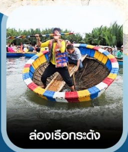
ล่องเรือกระดิง