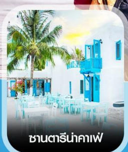
ซานตราโมนาคาเฟ่

✈️ คอนเฟิร์มออกเดินทาง ทุกพีเรียด 2 ท่านขึ้นไป